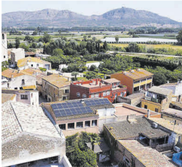
Plaques solars instal·lades a Gualta, un dels beneficiats.

■ La Diputació de Girona ha rebut gairebé 1,9 milions d'euros dels fons Next Generation per finançar projectes que impulsin la transició energètica a pobles petits de la demarcació. En concret, les ajudes es canalitzen a través del programa DUS 5000, que precisament s'adreça a municipis de menys de 5.000 habitants. A les comarques gironines, hi haurà quinze pobles que se'n beneficiaran per instal·lar plaques fotovoltaiques en edificis i equipaments municipals, renovar l'enllumenat públic amb tecnologia LED o substituir calderes de gas per altres de biomassa. L'objectiu de les ajudes europees és impulsar el desplegament de fonts de generació d'energia renovable als pobles petits i, de retruc, reduir les emissions de CO 2 .